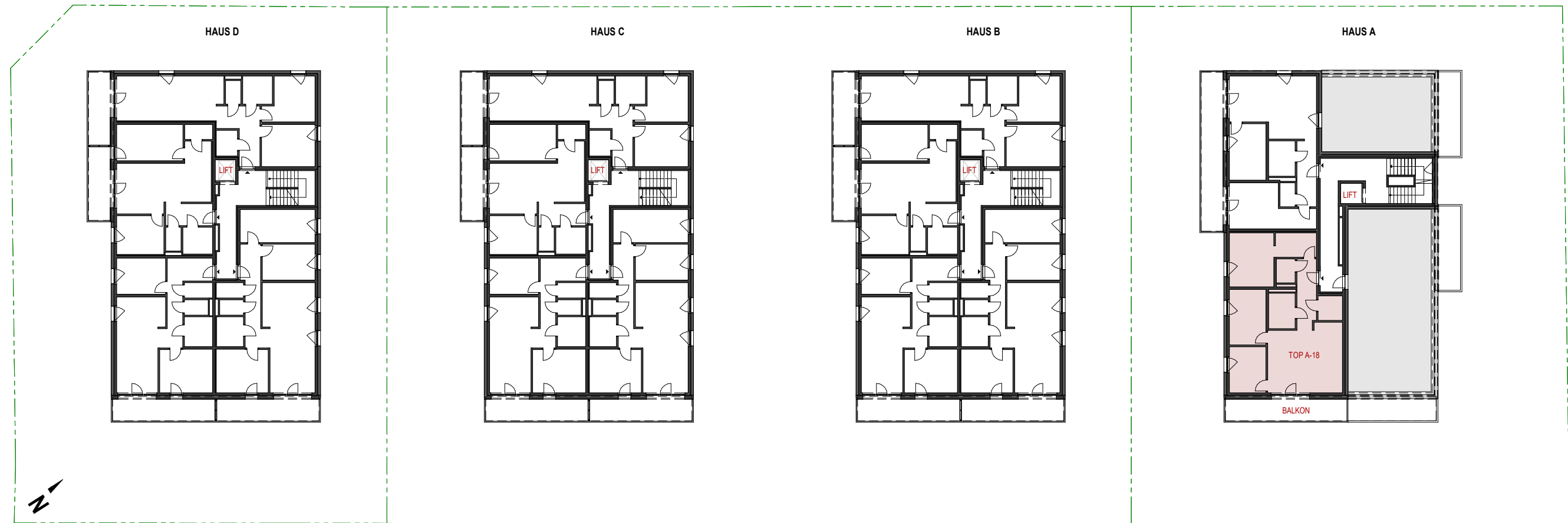
ÜBERSICHTSPLAN GRUNDRISS OG3 - M 1:350